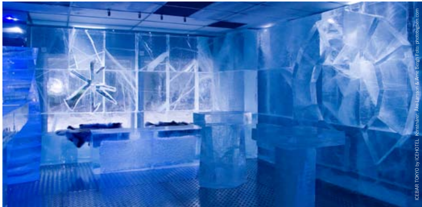
ICEBAR TOKYO by ICEHOTEL. Konstnär: Ake Larsson & Arne Bergh